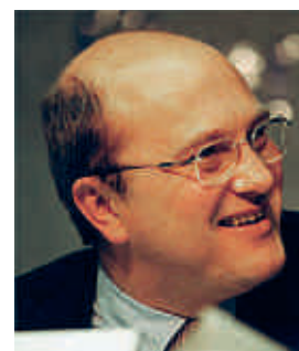
Luigi Pedrazzini, Staatsrat, Kanton Tessin

Die kantonalen Förderschwerpunkte des Tessins sind noch nicht definitiv bestimmt. Der Tourismus stand bisher nicht im Zentrum der Regionalentwicklung. Die Stärkung des Tessins als Feriendestination geht über die Instrumente der Regionalpolitik hinaus. Aber auch in Zukunft bleibt der Tourismus ein enorm wichtiger Wirtschaftssektor vor allem für die Regionen.