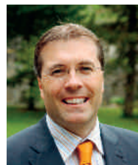
Jean-Michel Cina, Staatsrat, Kanton Wallis

tigny und Sierre (Informationstechnologien). Bleiben die Tourismusregionen im Berggebiet: Hier streben wir eine Reduktion auf neun Destinationen an. Gleichzeitig wollen wir die vier bisherigen Oberwalliser Regionen zu einer Region Oberwallis zusammenschliessen. Auch im Unterwallis steht eine Reduktion der vier bisherigen IHG-Regionen an.