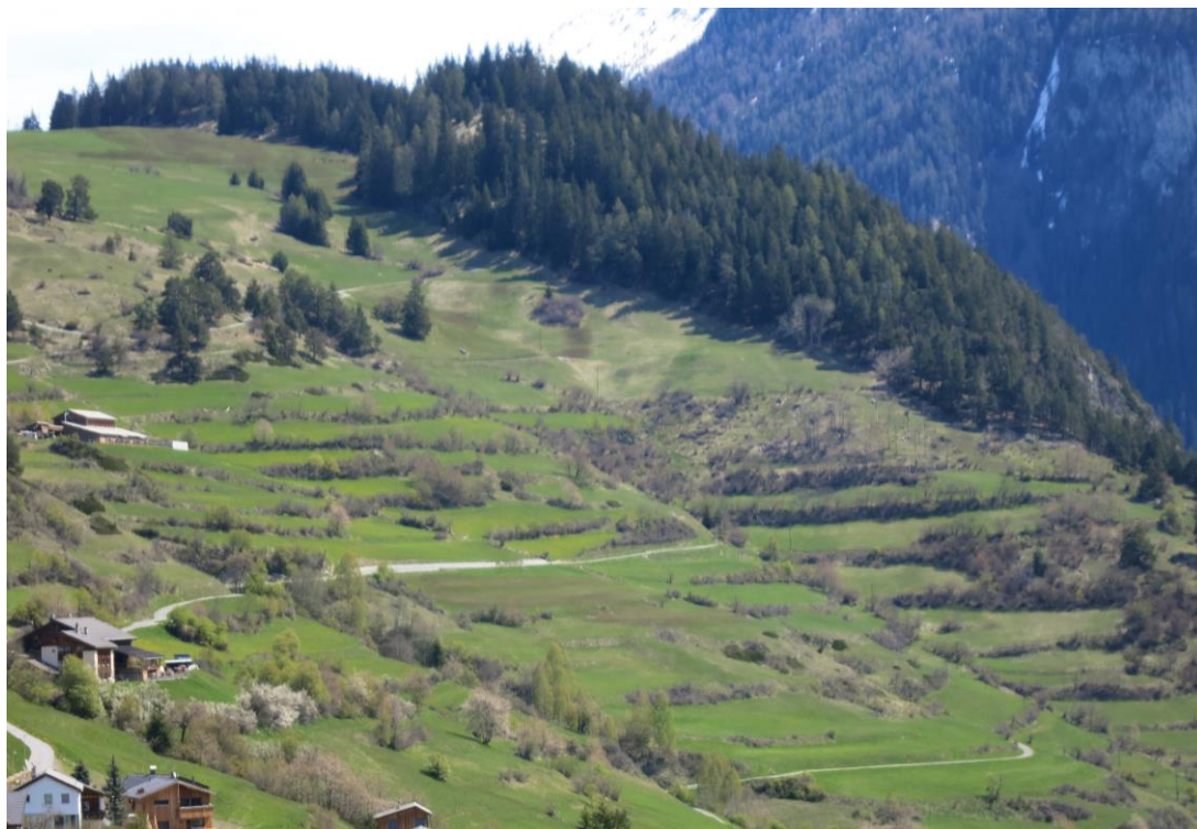
Paysage en terrasses à Ramosch