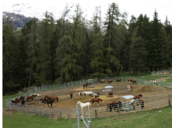
Ferme équestre San Jon, Scuol