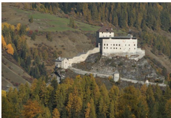
Château de Tarasp